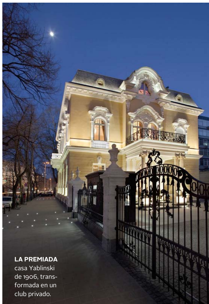
LA PREMIADA casa Yablinski de 1906, transformada en un club privado.

–Sí, el burnout completo. Quería estar tranquila. Tenía mucho éxito en mi profesión, pero me preguntaba qué viene ahora, ¿esto es lo que quiero?, ¿qué más puedo hacer? Tuve la suerte de viajar mucho, comprar lo que necesitaba... pero buscaba algo distinto. Decidí limpiarme de cosas que no necesito y partir de cero.