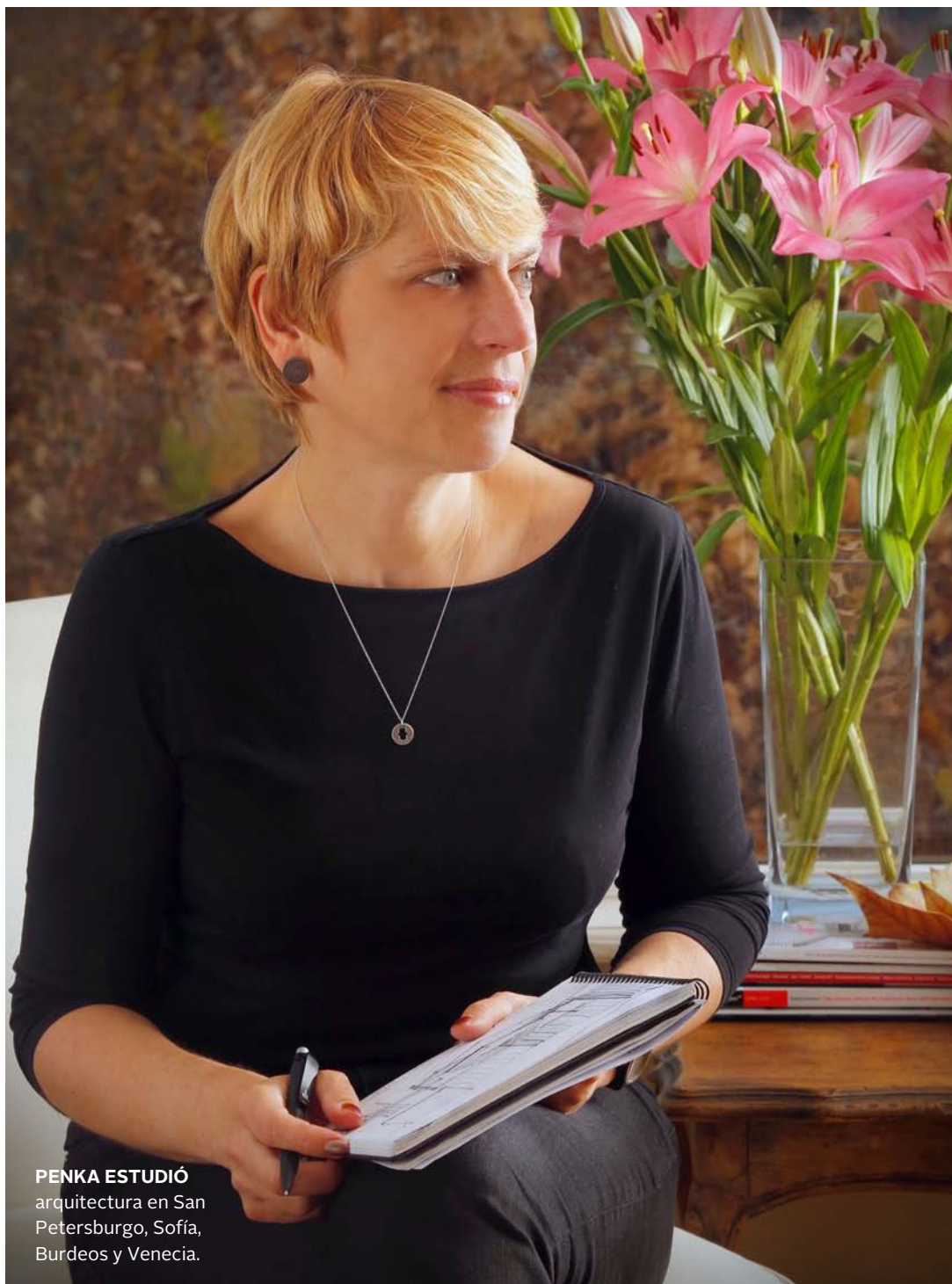
PENKA ESTUDIÓ arquitectura en San Petersburgo, Sofía, Burdeos y Venecia.

Texto, Soledad Salgado S. Retrato, Carla Pinilla G. Fotografías, gentileza PS Architects.